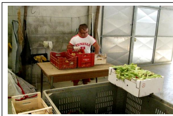
Personne handicapée au travail à la Ferme maraîchère bio Colombini (Pise, Toscane, Italie)

Nous vous donnons donc rendez-vous le 9 Novembre pour débattre de ces questions lors des Secondes Journées de l'agriculture sociale et thérapeutique en Rhône-Alpes.