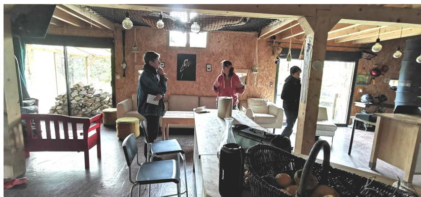
L'habitation dédiée à l'accueil des enfants

Karine Palomba, Ferme de Kaly 3 Jeandaleix, 63620 Giat ksoucasse@gmail.com