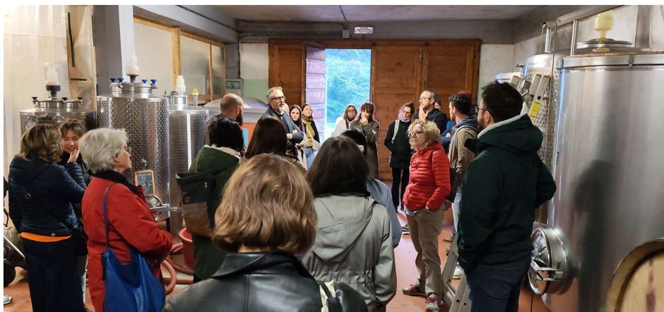
Dans la cave viticole de la La Calafata, coopérative agricole, Toscane (Nov. 2025)

Le financement du projet UPFARM est assuré par le FSE (Fonds Social Européen).