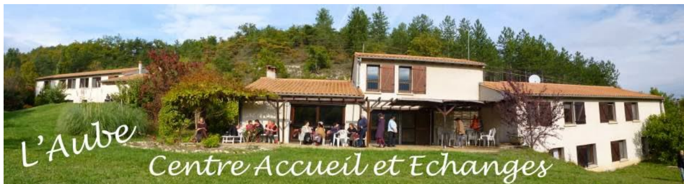
Le Centre L'Aube qui nous recevait et qui porte un projet d'agro-écologie et d'accueil

Retrouvez tout le compte-rendu des Rencontres sur le site internet : cliquez ici