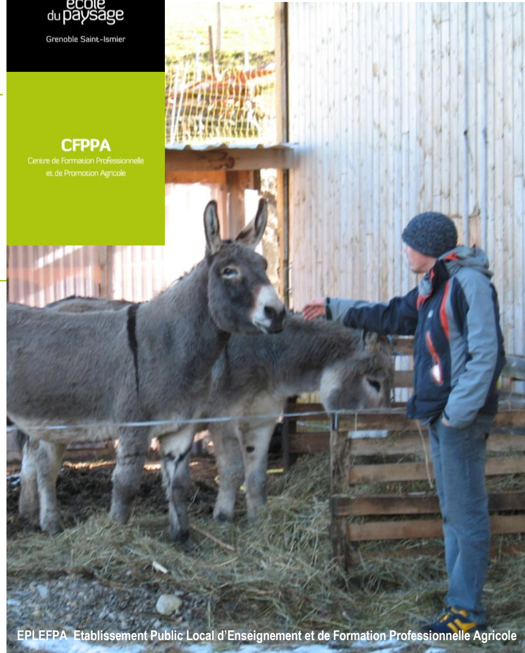
EPLEPPA Etablissement Public Local d'Enseignement et de Formation Professionnelle Agricole

Centre de Formation Professionnelle et de Promotion Agricole