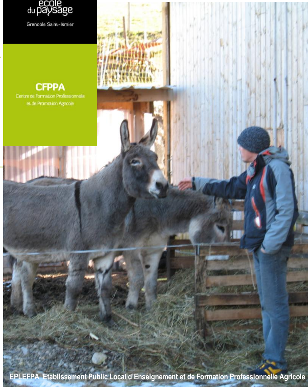
EPLEPPA Etablissement Public Local d'Enseignement et de Formation Professionnelle Agricole